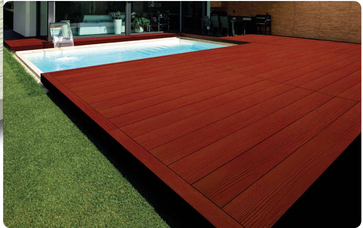
*สีผลิตภัณฑ์จริงอาจแตกต่างจากภาพ เนื่องจากระบบการพิมพ์

ไม้พื้นดูร่าวัน รุ่นลายไม้ เบบี้แอง ลอยโดดเด่น เป็นธรรมชาติ ด้วยลายไม้ที่ลวยงามเป็นธรรมชาติเหมือนไม้จริง พลายกับคุณสมบัติของไฟเบอร์ซีเมนต์ ซึ่งมีส่วนผสมมาจากปูนซีเมนต์ปอร์ตแลนด์ ซีลิก้าบริสุทธิ์ และเส้นใยเซลลูโลส ผ่านการอบไอน้ำที่อุณหภูมิและแรงดันสูง (Autoclave) ทำให้เบบี้แอง ทนทาน เนื้อเหนียว ไม่ยืดหดตัว ช่วยให้บ้านของคุณลวยงาม ยาวนาน